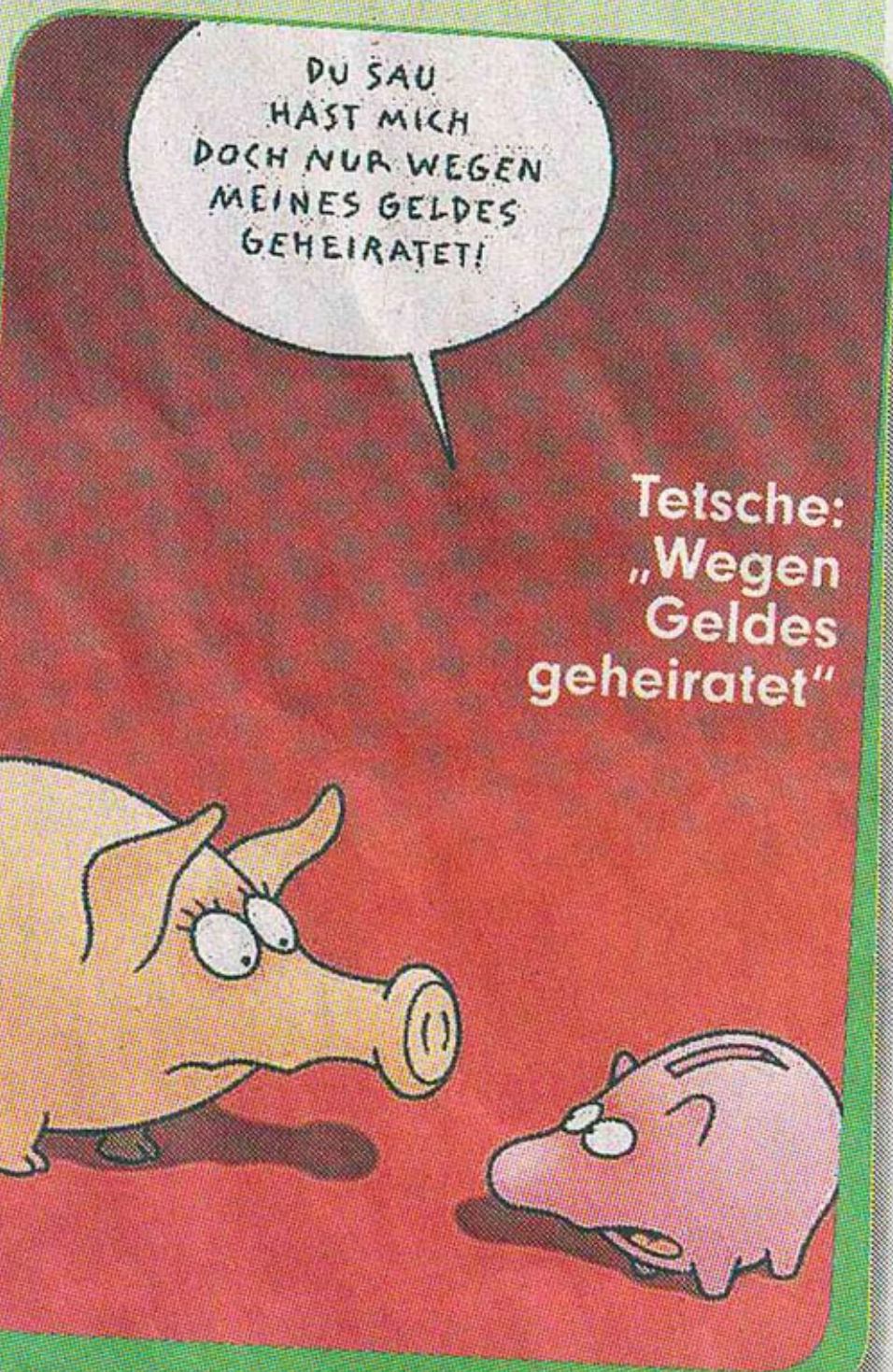
Tetsche: „Wegen Geldes geheiratet“