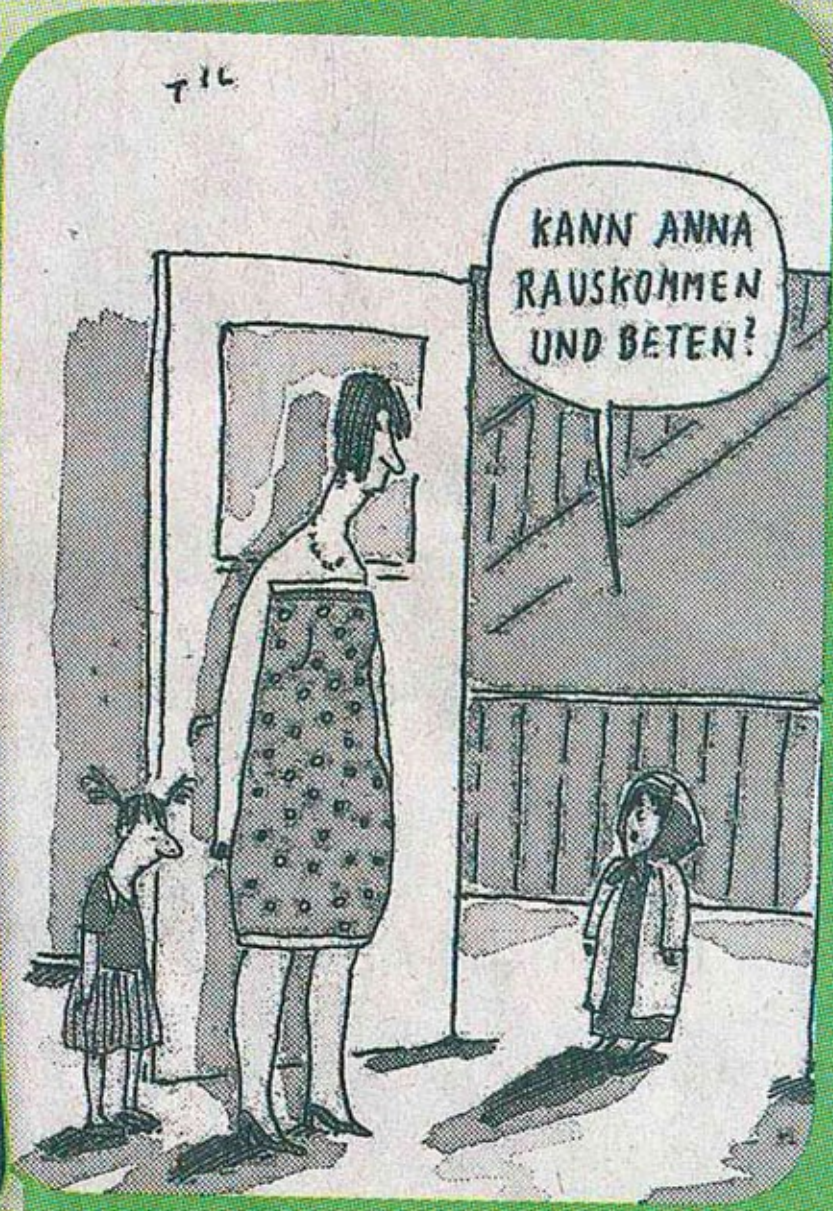
Til Mette: „Betten“